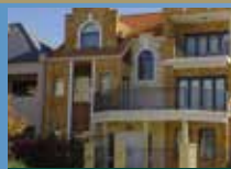
双层/四层复式公寓